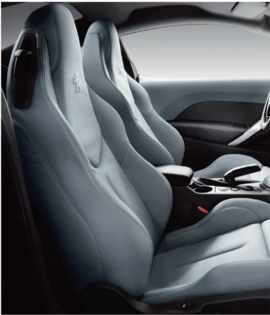
蓝灰色全真皮内饰