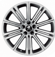
哑光 18 英寸